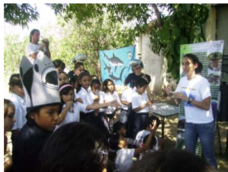
Día del Tiburón con PRETOMA

El PMP ha logrado a la fecha, sensibilizar a más de 1300 estudiantes de la zona, y seguirá impulsando nuevos proyectos que contribuyan a la valoración de los recursos marinos.