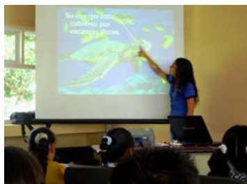
Charla sobre tortugas marinas

“Desde el 2003 el Parque Marino del Pacífico ha impartido charlas de educación marina a más de 2500 estudiantes de todo el país”