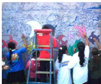
Día del Ambiente—Esc. José Rdo. Orlich

Por esta vía, muchos de los estudiantes del cantón central han conocido el PMP, recibido una charla educativa y participado en actividades de conservación o efemérides ambientales