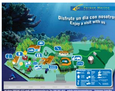
Mapa del Parque Marino del Pacífico

Luego puede confirmar la recepción del documento al teléfono 2661-5272/73, con la coordinación del Programa de Educación Ambiental.