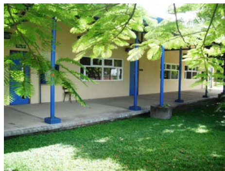
Aulas de Educación Ambiental

Este Programa de Educación se ha retroalimentado desde sus inicios con la intención de mejorar y satisfacer las necesidades formativas del sector educación ajustándose a los planes de estudio establecidos por el Ministerio de Educación Pública (MEP) de Costa Rica