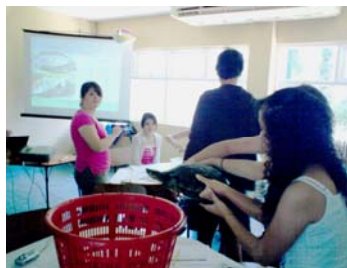
Taller básico sobre tortugas

Los talleres especiales pueden apreciarse como cursos resumidos sobre las ramas de la biología marina que se desarrollan en las diferentes áreas del Parque. Por la naturaleza de las actividades que involucran se requiere del apoyo de los profesores y la disponibilidad de tiempo del grupo, ya que los mismos inician a las 9:00 a.m. y finalizan a las 3:00 p.m. (incluyendo el espacio de refrigerio y almuerzo).