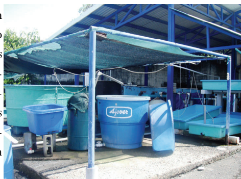
Área de cuarentena del CRRAM

El Centro de Rescate y Rehabilitación de Animales Marinos (CRRAM) nació como una necesidad ante los frecuentes hallazgos de los miembros de la comunidad puntarenense, quienes preocupados por los animales marinos y costeros que encontraban heridos, vieron al Parque Marino del Pacífico (PMP) como un centro de ayuda para su recuperación.