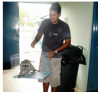
Liberación de mapache

Además, estas mascotas y otros animales capturados en la ciudad, nos obligan a cubrir transporte y gastos para realizar su reubicación. Recurso con el que no cuenta el Parque Marino actualmente.