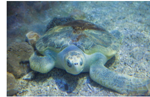
Mario Fernando, tortuga lora.

Shananda es la otra tortuga lora que vive en el Parque desde el 2004. Cuando se encontró enredada en una red de pesca, ya le faltaba una de sus aletas y otra estaba prácticamente amputada. A pesar de los esfuerzos la fuerte infección no permitió salvarle ese miembro, por lo que ahora debe moverse con solo sus aletas derechas, lo que le impide nadar con facilidad y rápido, como para alcanzar ella misma sus presas. Shananda llegó pesando 2,5 Kg, a la fecha pesa más de 35 Kg, lo que demuestra su buen desarrollo.