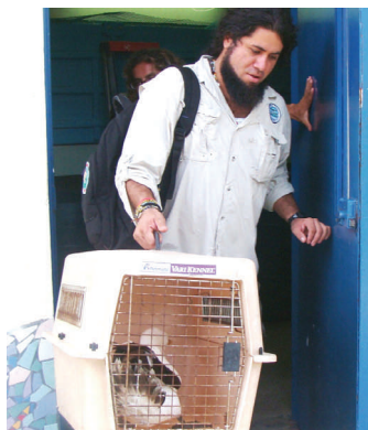
Reubicación de alcatraz hacia la Isla del Coco

Usted puede salvar una vida, ayudando a que el CRRAM siga creciendo, dando más y mejores oportunidades a los ani-