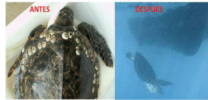
Recuperación de Lucía (tortuga carey)

En el 2009 se decomisaron 2 neonatos de tortuga baula que habían sido vendidos en la capital. Estuvieron pocos días en el CRRAM, mientras se investigaba a que costa pertenecían.