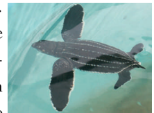
Neonato de baula rescatado

Por la temporada de anidación se determinó que provenían del Caribe, por lo que se entregaron a la